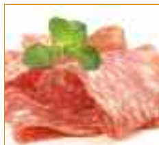
petites charcuteries Vleeswaren