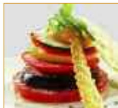
fruits et légumes Groente en fruit