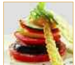
fruits and vegetables Obst und Gemüse