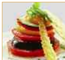
fruits et légumes Groente en fruit