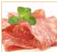
petites charcuteries Vleeswaren